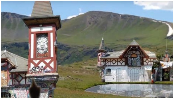
Curse of Conformity Videoinstallation, 1'50, 2013