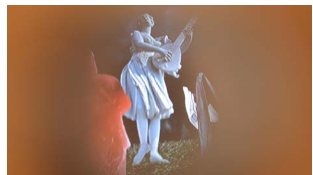
Illusions of Safety Videoinstallation, 3'40, 2013