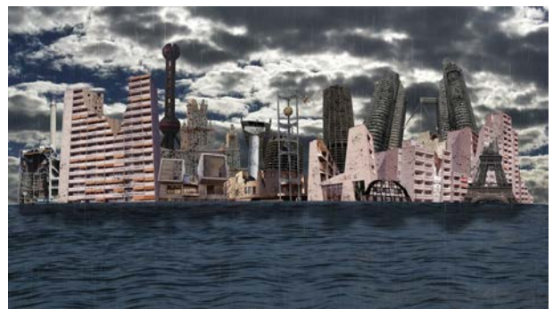
Remember Civilisation...?! HD Video, 3', 2019