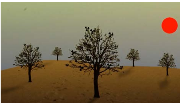
Nippon Nightmare HD Video, 0'40, 2011