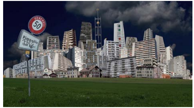
Pimpolis HD Video, 12', 2012