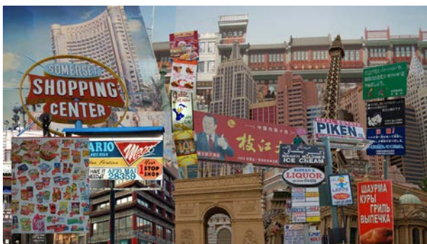
Globocity - Rise and Fall HD Video, 20', 2009