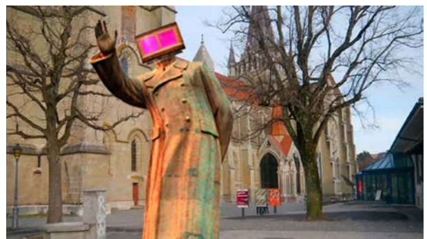
Freedom Fighters Augmented Reality, Virtuale Switzerland, 2015