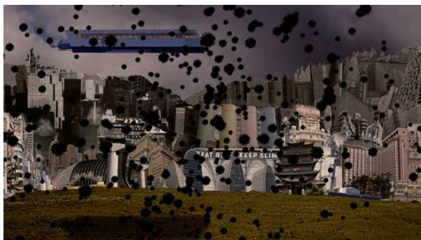
Pandemonic HD Video, 2'45, 2020