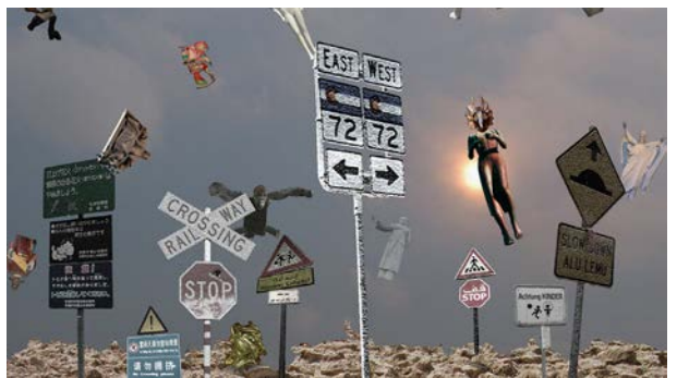
Götzen Fallen HD Video, 2', 2011