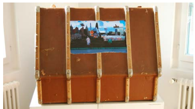
Globocity - Around the World in 80 Seconds Videoinstallation, 1'40, 2009