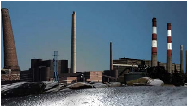
Transition to the Postindustrial Age VR Video, 2', 2021