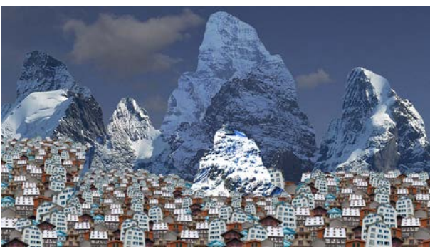
Clima(c)tic Changes 5 HD Videos, 1'10', 2015