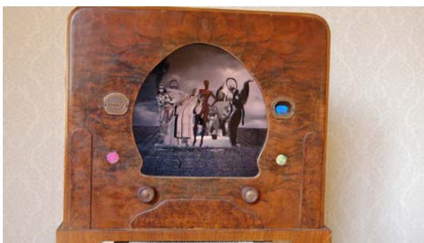
Disturbing Dancing Party Videoinstallation, 2', 2009