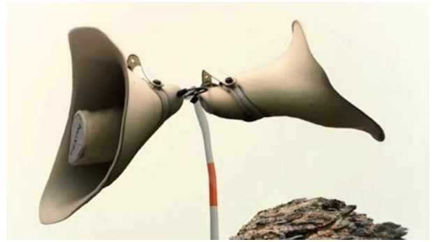
10 Animationen für 25 Jahre RaBe 10 Animated Gif, 4"-20", 2021